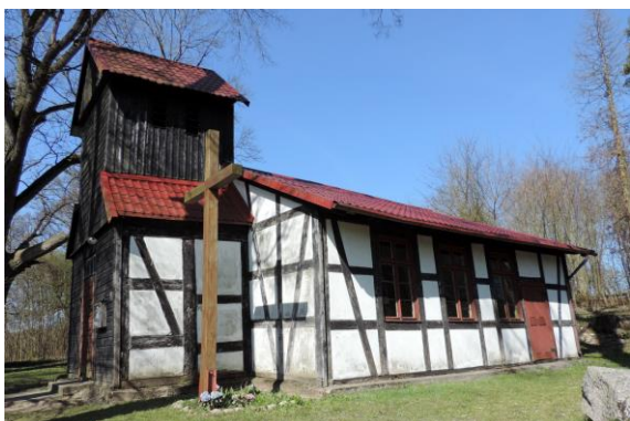
Zdjęcie nr 10. Kościół filialny pw. Trójcy Świętej w Sownie