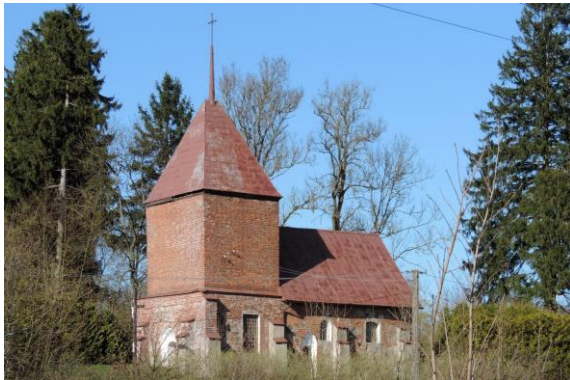
Zdjęcie nr 9. Kościół filialny pw. Matki Boskiej Różańcowej w Sierakowie Sławieńskim

Kościół wzniesiony na pocz. XV w. Usytuowany jest w centrum wsi, na wzniesieniu, na skraju parku dworskiego, otoczony placem przykościelnym o kształcie zbliżonym do prostokąta.