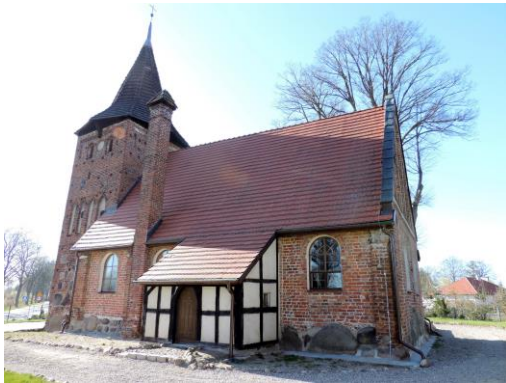
Zdjęcie nr 11. Kościół filialny pw. Podwyższenia Krzyża Świętego w Suchej Koszalińskiej

Kościół wzniesiony w XIV w., przebudowany w XV w. Usytuowany w centrum wsi, na szczycie wzniesienia, na terenie placu przykościelnego widoczne ślady po dawnym cmentarzu.