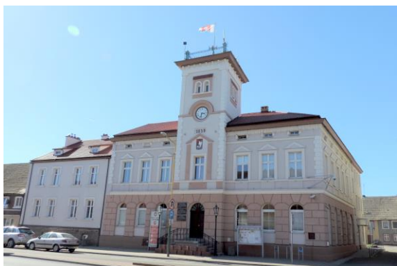
Zdjęcie nr 13. Ratusz w Sianowie, ul. Armii Polskiej 30

Budynek wzniesiony w 1879 r. Jest to budynek wolnostojący, usytuowany w ciągu zabudowy ulicy, murowany, z cegły ceramicznej pełnej, na zaprawie cementowo - wapiennej. Fundament pod korpusem budynku z cegły. Budynek założony na planie litery L, o dwóch traktach wzdłużnych. Bryła budynku zwarta, złożona z prostokątnego korpusu oraz