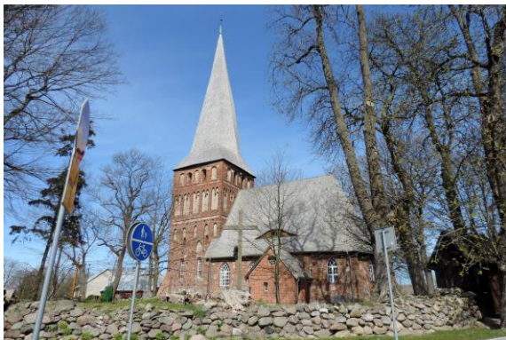
Zdjęcie nr 2. Kościół filialny pw. Matki Boskiej Królowej Polski w Iwęcinnie

Kościół powstał pod k. XIV w. Otoczony jest kamiennym murem z trzema drewnianymi bramami pochodzącymi z 1725 r., poł. XVIII w. i poł. XIX w. Pierwotnie budynek miał wieżę, zwieńczoną czterema pinaklami. Wieży nadano pochYLENIE w kierunku zach. aby uchronić ją przed częstymi, silnymi wiatrami zachodnimi. Wieża i nawa kościoła były pokryte gontami dębowymi.