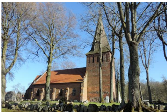
Zdjęcie nr 4. Kościół filialny pw. św. Antoniego Padewskiego w Osiekach

Kościół w średniowieczu był świątynią pielgrzymkową, słynącą z cudu Krwawiejącej Hostii. Usytuowany jest w płn. Części wsi, otoczony prostokątnym placem przykościelnym. Kościół gotycki budowany w dwóch etapach w poł. XIV w.