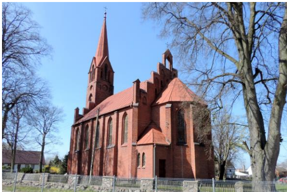
Zdjęcie nr 8. Kościół parafialny pw. Najświętszego Serca Pana Jezusa w Siecieminiu

Kościół powstał w 1826 r. ?, usytuowany jest w pld. części wsi, na płaskim terenie po dawnym cmentarzu wiejskim, otoczony nieregularnym placem zbliżonym do trójkąta. Na terenie placu znajduje się pomnik poległych w I wojnie światowej.