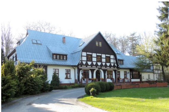
Zdjęcie nr 15. Dwór w Osiekach nr 42

Dwór został wybudowany w latach 1922 - 1926. Budowla wzniesiona w stylu klasycystycznym, w kostiumie ryglowego dworku myśliwskiego, z bogatym detalem snycerskim. Do czasów współczesnych przetrwała z licznymi przebudowami, oraz przekształceniem wnętrza, ale z możliwością odtworzenia pierwotnego układu traktów. Czas wojny dwór przetrwał bez większych zniszczeń. Jedynie sąsiadujący z dworem od półn. mały budynek w konstrukcji ryglowej został całkowicie zdewastowany, a później rozebrany przez stacjonujących tu Rosjan. W chwili obecnej mieści się tu Ośrodek hotelowy.