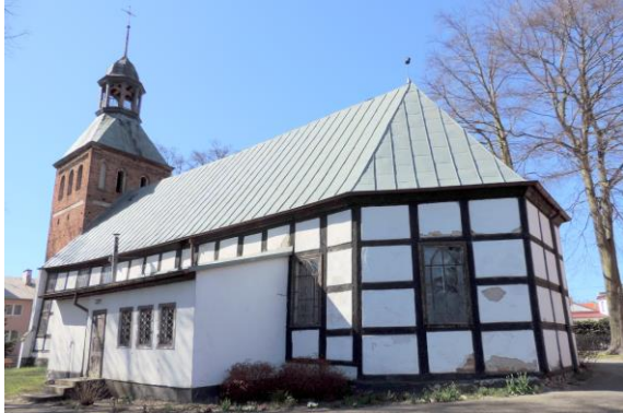
Zdjęcie nr 7. Kościół parafialny pw. św. Stanisława Kostki w Sianowie, ul. Kościelna

Kościół wybudowany w dwóch etapach: późnogotycka wieża ceglana z XVI w. z młyńskim kołem nad portalem, zwieńczona barokowym szczytem oraz szachulcowa (ryglowa) nawa wzniesiona w 1793 r. zamknięta wielobocznym prezbiterium. Kościół poświęcony w dniu 21 października 1945 r. jako kościół katolicki. Kościół posiada bogate wyposażenie w stylu renesansowym z XVII w.: ołtarz główny, ambonę i empore organową. Wyposażenie z innych stylów to: gotycki krucyfik i barokowe świeczniki wieloramienne. Nad wejściem do świątyni umieszczony kamień młyński.