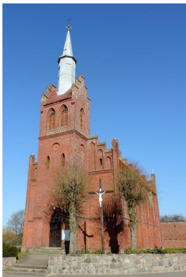
Zdjęcie nr 12. Kościół parafialny pw. Matki Bożej Szkaplerznej w Szczeglinie

Kościół wybudowany w 1908 r. w stylu neogotyckim. Jest usytuowany w centrum wsi, na placu przykościelnym o kształcie zbliżonym do trapezu.