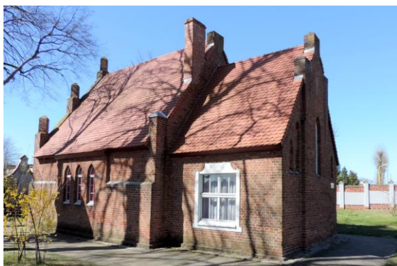
Zdjęcie nr 6. Kaplica cmentarna w Sianowie, ul. Węgorzewska

Kościół usytuowany w płd. - wsch. części miasta, zbudowany na płaskim terenie. Otoczony nieregularnym cmentarzem zbliżonym do prostokąta. Kościół znajduje się w zach. narożniku cmentarza. Kościół powstał w XIX w.