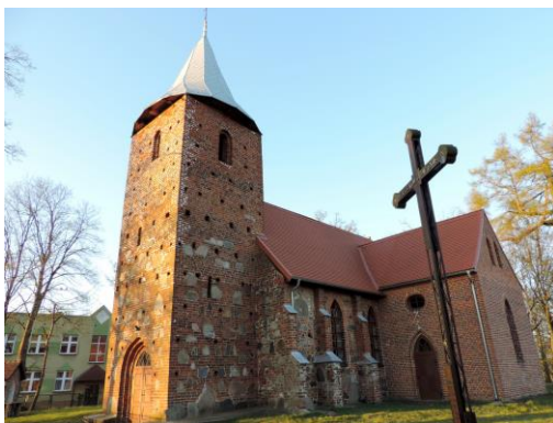
Zdjęcie nr 1. Kościół filialny pw. św. Stanisława Kostki w Dąbrowie

Kościół założony przez Cystersów, pochodzi z 2 poł. XIV w., w poł. XIX w. częściowo przebudowany. Pierwotnie poświęcony Św. Wawrzyńcowi - relikwie świętego miały się znajdować wraz z dokumentami biskupa Martina Caritha z 1507 r. w drewnianej kapsule. Bryła kościoła nie uległa drastycznym przebudowom i zachowała wiele cech