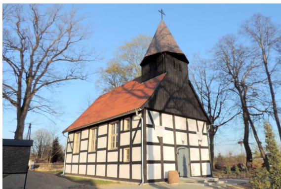
Zdjęcie nr 3. Kościół filialny pw. Najświętszego Serca Pana Jezusa w Karnieszewicach

Kościół zbudowany w 1803 r. przez mistrza Martina Karstena, na miejscu wcześniej wzmiankowanej świątyni, która spłonęła w 1801 r. Obecna budowla powstała w 1803 r. Przy kościele cmentarz przykościelny, porośnięty starodrzewem.