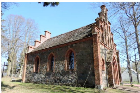
Zdjęcie nr 5. Kościół filialny pw. św. Wojciecha w Ratajkach

Kościół usytuowany jest w płn. - wsch. części wsi, na miejscowym, obecnie nieczynnym cmentarzu, porośnięty przez cenny starodrzew. Budowla ufundowana została przez dawnego właściciela wsi Ludendorfa w 1860 r. Za kościołem znajduje się poniemiecki cmentarz z zachowanymi częściowo nagrobkami, w zach. części cmentarza wydzielono część współczesnych nagrobków.