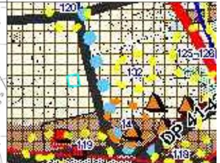
WYRYS ZE STUDIUM UWARUNKOWAN I KIERUNKÓW ZAGOSPODAROWANIA PRZESTRZENNEGO GMINY DOBRA

GRANICA OBSZARU OBJĘTEGO MIEJSCOWYM PLANEM ZAGOSPODAROWANIA PRZESTRZENNEGO TERENY ROZNOJAK FUNKCJI MIESZKALNEJ I TOWARZYSZĄCEJ UŻYTKOWEJ W RAMACH JEDNOSTEK STRUKTURALNYCH WÓD PODZIEMNYCH