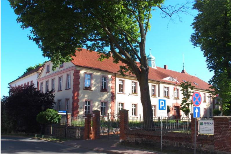
Zdjęcie nr 9. Kolegium Jezuickie („Ateny Waleckie”), obecnie Zespół Szkół Nr 1, ul. Kilińszczaków 59

Budynek wzniesiony na miejscu starszego w latach 1798-1805 w skromnym stylu klasycystycznym, przebudowany w 2 poł. XIX w., przez kolejne remonty częściowo pozbawiony pierwotnego wystroju architektonicznego. Okres największej świetności instytucji przypada na przełom XVII/XVIII w., kiedy uczyło się tutaj około 200 uczniów, a ze względu na wysoki poziom nauczania kolegium wybierała nawet protestancka młodzież z ościennej Brandenburgii. W 1781 r. przekształcone w gimnazjum królewskie. W lipcu 1945 r. w budynku otworzono gimnazjum i liceum polskie. Od 1977 r. mieści się tutaj również Szkoła Mistrzostwa Sportowego.