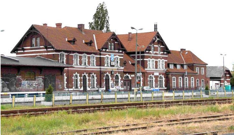
Zdjęcie nr 20. Dworzec PKP, ul. Kolejowa

Budynek oddany do użytku w 1881 r., typowy przykład budownictwa kolejowego z przełomu XIX/XX w.: murowany z cegły, z tynkowanym detalem (gzymsy, fryzy, opaski okien okarągłolucznych i zamkniętych odcinkiem łuku). Malowniczości rozczłonkowanej bryły dodają krążynowe wsporniki podtrzymujące okapy dachów szczytów budynku.