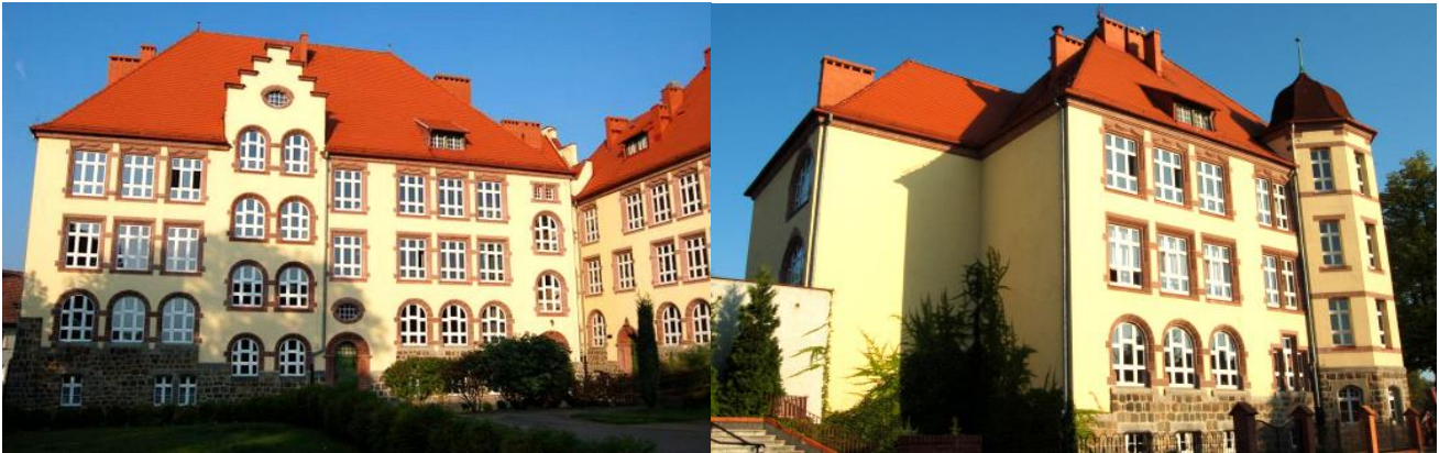
Zdjęcia nr 19, 20. Seminarium Nauczycielskie, Miejska Szkoła Centralna (ewangelicka, katolicka i żydowska), obecnie Szkoła Podstawowa nr 2 im. Roberta Schumana, ul. ul. M. Konopnickiej 2, źródło: http://www.dioblina.eu/Gimnazjum_nr_2_im_Roberta_Schumana

Budynek wzniesiony w latach 1901-1905, według konkursowego projektu lipskiego architekta Maxa Schonberga, neorenesansowa