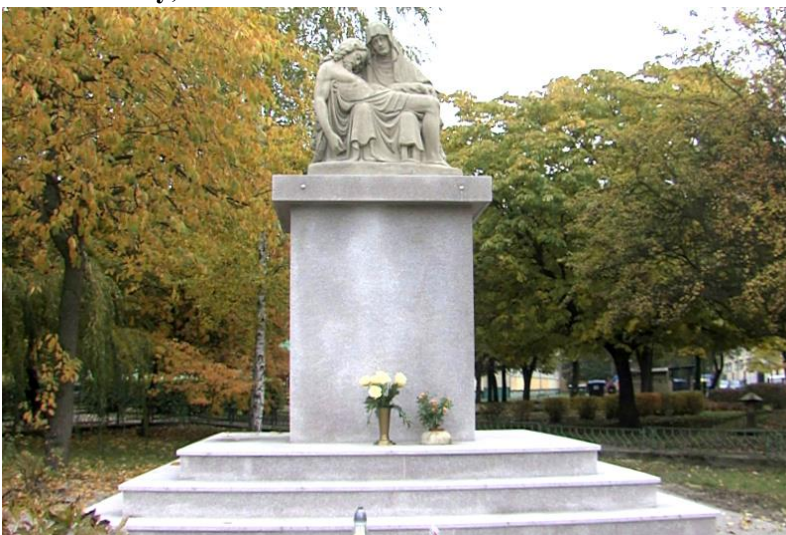
Zdjęcie nr 32. Pomnik Piety, ul. Kościuszki

Początkowo zlokalizowany na skrzyżowaniu ulic Bydgoskiej, Kilińszczaków, Wojska Polskiego i Kościuszki. W 1976 r. z powodu modernizacji dróg przeniesiony między bloki mieszkalne, na początku ul. Kościuszki. Rzeźba z kamienia, umieszczona na prostokątnym cokole. Ufundowana przez katolików niemieckich przed I wojną światową, jako wotum za ocalenie od epidemii, która zagrażała mieszkańcom