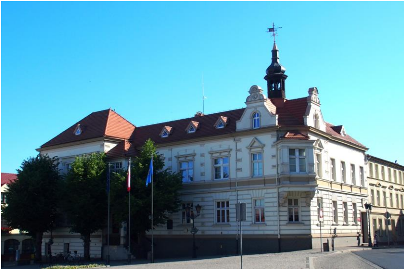
Zdjęcie nr 11. Ratusz, Plac Wolności 1

Zbudowany w latach 1888-1890, według projektu Alberta Schura. W 1937 r. rozbudowano budynek dodając nowe skrzydło. Eklektyczny z elementami neorenesansu i neoklasycyzmu.