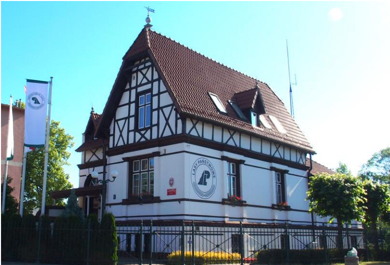
Zdjęcie nr 25. Budynek Nadleśnictwa, ul. Kołobrzaska 1a

Budynek o znacznie rozcłunkowanej bryle, wysoko podpiwniczony, jednokondygnacyjny, w części podwyższony o kondygnację wysokiego poddasza, nakryty dachami naczółkowymi, rozcłunkowanymi lukarnami pod daszkami dwuspadowymi. Ściany murowane, tynkowane, poddasze w konstrukcji ryglowej z tynkowanym wypełnieniem. W elewacji frontowej – taras konturowany balustradą tralkową, osłonięty dachem wspartym na kolumnkach.