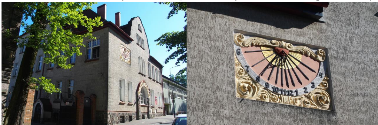
Zdjęcia nr 17, 18. Szkoła Żeńska, dawniej Gimnazjum nr 3, a obecnie w budynku mieszczą się pomieszczenia różnych stowarzyszeń działających na rzecz mieszkańców Wałcza m.in.: Ośrodek Rehabilitacyjno-Edukacyjno-Wychowawczy czy Spółdzielnia Socjalna „Ważka”.

Budynek wzniesiony w ok. 1910 r. Budynek podpiwniczony, dwukondygnacyjny, nakryty czterospadowym dachem z naczółkiem, rozczłonkowanym szczytem o falistym wykroju – w fasadzie i czteroosiową facjatą w połaci bocznej. Murowany, tynkowany, z cokołem licowanym kamieniem i detalem wypracowanym w tynku. Szczyt w fasadzie akcentuje oś pierwotnego wejścia: szeroki, arkadowy otwór, ramowany portalem o faliście wykrojonej archiwolcie ramowanej sztukatorską dekoracją z herbem Wałcza. Nad portalem triforium zamknięte odcinkiem łuku. Otwory okienne prostokątne, osadzone na parapetach. W drugiej kondygnacji zachodniej części fasady – zegar słoneczny z dekoracją z motywami roślinnymi.