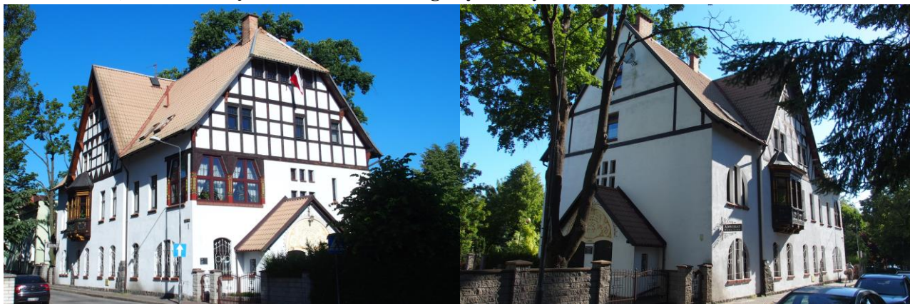
Zdjęcia nr 26, 27. Willa Stelzer, obecnie budynek mieszkalno-usługowy, ul. Sądowa 1

Budynek powstał na przełomie XIX i XX w. Jest to dwukondygnacyjny budynek z użytkowym poddaszem, nakryty naczółkowym dachem, z płytkim ryzalitem zwieńczonym wydatnym trójkątnym szczytem nakrytym dwuspadowo – w elewacji frontowej. Ściany murowane, tynkowane, szczyty – w konstrukcji ryglowej z tynkowanym wypełnieniem. W górnej kondygnacji ryzalitu rozmieszczony niesymetrycznie trójboczny, drewniany wykusz, z rozbudowaną dekoracją snycerską.