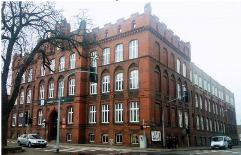
Zdjęcie nr 14. Szkoła Budowlana, obecnie Zespół Szkół nr 3 - „Zawodówka”, ul Bankowa 13

Neogotycki parterowy budynek, wzniesiony jako ujeżdżalnia koni pułku ułanów w 1870 r., adaptowany do funkcji szkoły w 1885 r. (obecnie główne skrzydło od ul. Bankowej) i rozbudowany w 1904 r. (skrzydło od ul. gen. Leopolda Okulickiego) – wówczas budynek uzyskał obecną formę. Otwarcie szkoły miało miejsce we wrześniu 1877 r. W 1998 r. na skwerze przed szkołą, w 80-tą rocznicę niepodległości, ustawiono pomnik Marszałka Józefa Piłsudskiego.