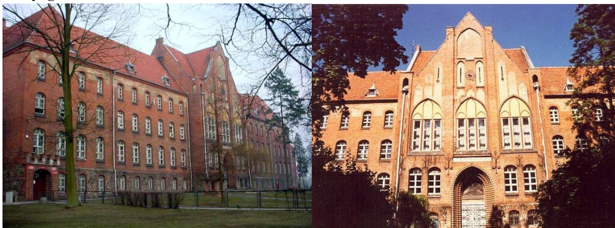
Zdjęcie nr 15, 16. Królewskie seminarium nauczycielskie, obecnie Budynek Oświaty w Zasobie Starostwa Powiatowego, ul. Bydgoska 50-52, źródło: http://nk.pl/szkola/93828/galeria/1

Budynek wzniesiony w latach 1902-1905, w stylu eklektycznym z przewagą elementów neogotyckich. Gmach założony na rzucie zbliżonym do litery E, ze skrzydłami bocznymi, o rozczłonkowanej bryle zróżnicowanej wysokościowo, urozmaiconej kształtami dachów. Murowany z cegły na cokole licowanym kamieniem. Otwory okienne rozmieszczone rytmicznie, zamknięte łukiem odcinkowym. We frontowym ryzalicie ostrołuczny, schodkowo profilowany portal, w drugiej kondygnacji – prostokątne triforia osadzone w ostrołucznych blendach o tynkowanych podłuczach, rozdzielone nadwieszonymi lizenami. W budynku występują również ostrołuczne biforia osadzone w ostrołucznych blendach dopełnionych kolistym tondem w podłuczcu oraz zróżnicowane podziały blendowe. We wnętrzu zabytkowa klatka schodowa przykryta sklepieniami krzyżowo-żebrowymi gwiazdzistymi, wspartymi na kolumnach.