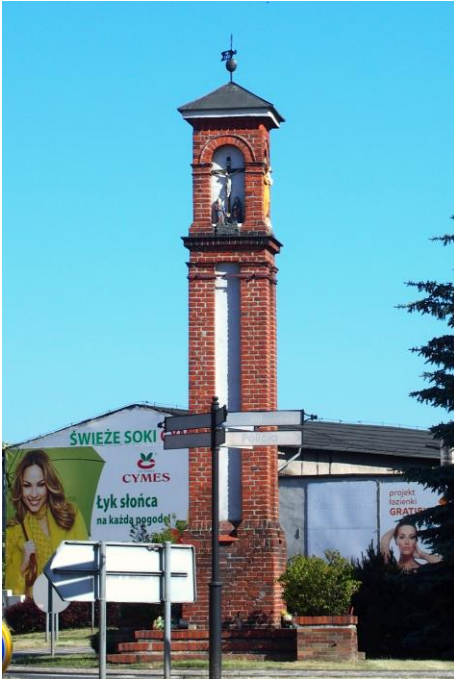
Zdjęcie nr 31. Kapliczka słupowa przy Rondzie Solidarności