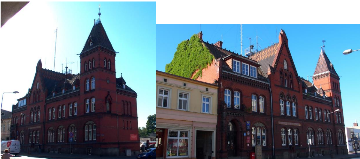
Zdjęcia nr 11, 12. Budynek poczty, ul. Kilińszczaków 30

Budynek wzniesiony w 1895 r., neogotycki. Wysoko podpiwniczony budynek dwukondygnacyjny na rzucie prostokąta, nakryty czterospadowym dachem, o znacznie rozczłonkowanej bryle. W narożu