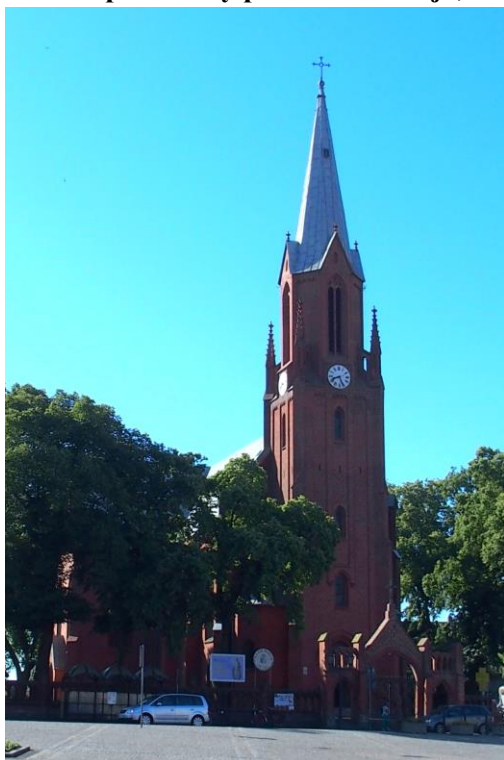
Zdjęcie nr 1. Kościół parafialny pw. św. Mikołaja, Plac Wolności

Kościół wzniesiony w latach 1863-1865, neogotycki. Parafia erygowana w 1303 r. i ponownie w 1602 r. Pierwszy kościół spłonął w 1378 r. Jak wyglądał kolejny budynek nie wiadomo.