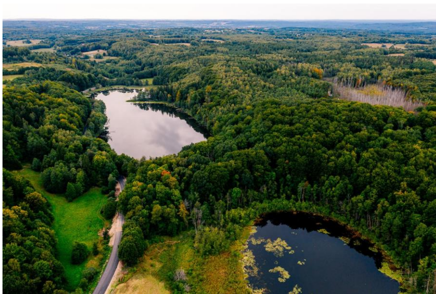
Fotografia 1. Widok na krajobraz gminy Połczyn – Zdrój – tzw. „Szwajcaria Połczyńska”.

Gmina Połczyn-Zdrój wyróżnia się spośród innych Gmin zróżnicowanym krajobrazem, który określany jest „Szwajcarią Połczyńską”. „Szwajcaria Połczyńska” - unikalny przyrodniczo mikroregion rozciągający się na obszarze gmin Połczyn-Zdrój, Złocieniec, Barwice, Czaplunek i gminy wiejskiej Świdwin. Sercem Szwajcarii Połczyńskiej jest Dolina Pięciu Jezior, czyli obszar rezerwatu krajobrazowego pomiędzy Połczynem-Zdrojem a Czaplinskim, który jest jednym z najbardziej malowniczych miejsc na terenie całego Województwa Zachodniopomorskiego. Okolica zawdzięcza nazwę malowniczo otoczeniu wysokich (ponad 200 m) wzgórz morenowych pokrytych pastwiskami i lasami. Znajduje się tam jedno z najwyższych wzniesień zachodniego pomorza – Wola Góra (219,2 m n.p.m.), na której szczycie wzniesiono wieżę obserwacyjną. To również miejsce, gdzie źródło ma rzeka Drawa. Rzeka ma długość 185,9 km. Jej koryto wytycza szlak wodny im. Ks. Kardynała Karola Wojtyły, bowiem przyszły Papież kilkakrotnie spływał Drawą na kajaku. „Szwajcaria” to także szlaki turystyczne, piesze i rowerowe, które wiodąc przez zbocza i doliny z rwącymi strumieniami i jeziorami, tworzą niemalże górski krajobraz. To naturalne otoczenie tworzy wyjątkowy, łagodny mikroklimat, sprzyjający leczeniu wielu chorób.