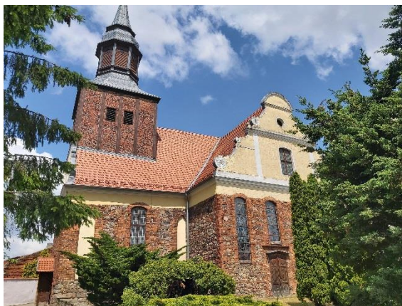
Ryc. 3. Kościół pw. Narodzenia NMP w Pełczycach

Obiektem o najwyższej randze, charakteryzującym się najbogatszą formą architektoniczną jest kościół parafialny w Pełczycach. Budowla powstawała w wielu fazach od XIII do XVIII w. bardzo dobrze czytelnym w obecnej architekturze świątyni i tworzącym harmonijną całość, dokumentującą rozwój świątyni od czasu średniowiecza po okres baroku. Charakterystycznymi elementami architektury kościoła są wolutowe barokowe szczyty oraz hełm wieży, stanowiący rozpoznawalną dominantę panoramy miasta.