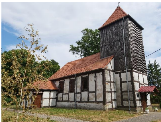
Ryc. 7. Kościół pw. św. Józefa Oblubieńca w Płotnie

Na terenie gminy Pełczyce zachowała się tylko jedna świątynia ryglowa. Jest to pochodzący z XVIII w. kościół w Płotnie, który – jak inne świątynie na terenie gminy – także nosi ślady znacznych ingerencji przeprowadzonych podczas XX-wiecznej przebudowy.