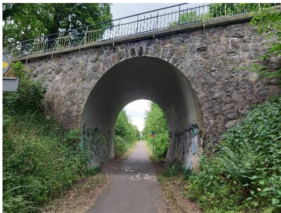
Ryc. 13. Wiadukt kolejowy niedaleko Wierzbna

Inne obiekty związane wyłącznie z przetwórstwem rolno-spożywczym usytuowane były dawniej w obrębie folwarków. W większości zatraciły one swoje pierwotne funkcje i zostały pozbawione walorów zabytkowych. Do najlepiej zachowanych należą budynki dawnych gorzelni w Płotnie i Sarniku.