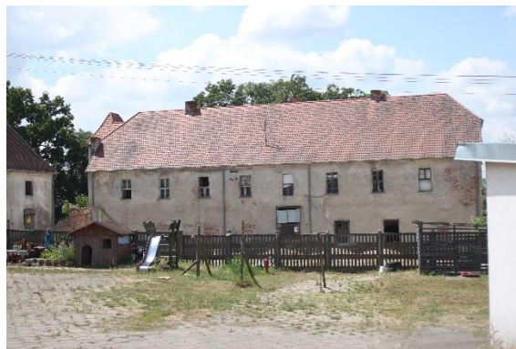
Ryc. 4. Zabudowa dawnego zespołu klasztornego cysterek w Pełczycach