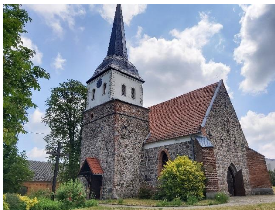
Ryc. 5. Kościoły: pw. Świętej Rodziny w Chrapowie (po lewej) i pw. Matki Boskiej Częstochowskiej w Przekolnie (po prawej)

Z okresu od XV do XVIII w. pochodzi pięć kolejnych świątyń: w Będargowie, Boguszynach, Bolewicach, Niesporowicach i Sarniku. Większość z nich nosi ślady różnych przekształceń przeprowadzonych w II poł. XIX i I poł. XX w., gdy na szeroką skalę odnawiano obiekty sakralne, dostosowując budynki do zmieniających się potrzeb funkcjonalnych i obowiązujących gustów. Przeważnie zachowywano oryginalne mury obwodowe kościołów, zmieniając formy i wielkość otworów okiennych i dodając nowe detale (np. ceramiczne fryzy podokapowe). Często praktyką było dobudowywanie do istniejącego korpusów nawowych wież zachodnich o formach nawiązujących do architektury neogotyckiej. Czasem przemurowywano lub murowano na nowo szczyty naw, co wiązało się z remontem lub wymianą dawnych więźb dachowych. Spośród tej grupy świątyń wyróżnia się kościół w Niesporowicach – wyjątkowo bogatym rozwiązaniem portalu południowego ze śladami dawnych polichromii.