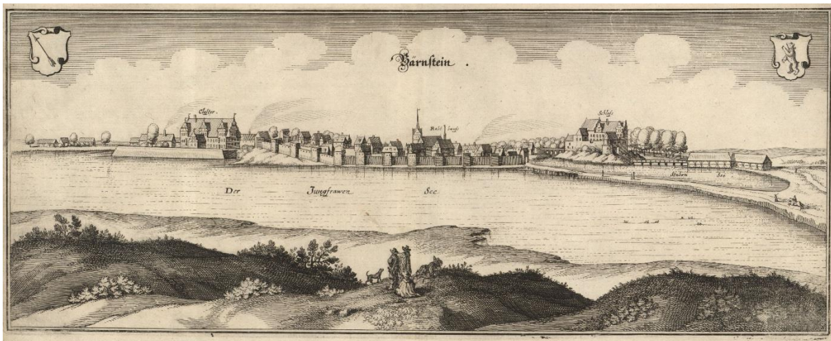
Ryc. 1. Panorama Pełczyc na miedziorycie Matthaeusa Meriana [rycina z dzieła M. Zeiller, „Topographia Electoratus Brandenburgici et Ducatus Pomeraniae” (1652). Tabl. XVI]

Na wschód od Starego Miasta, z niewielkiej osady o wczesnośredniowiecznym rodowodzie i rzemieślniczym charakterze rzemieślniczym, wykształcił się miejski układ urbanistyczny. Jego główną osią był średniowieczny szlak handlowy łączący Berlin ze Świdwinem. Z czasem ta część Pełczyc zyskała nazwę Nowego Miasta. Ze względu na naturalne ukształtowanie terenu układ przestrzenny Nowego Miasta uzyskał nieregularną formę z rynkiem na planie trapezu. Nowe Miasto otoczone mokradłami i korzystające z ochrony pobliskiego grodu i umocnionego Starego Miasta nie miało obwarowań a jedynie trzy bramy, których zasadniczą funkcją był pobór myta. W sąsiedztwie Nowego Miasta, ok. 1290 r., na wyspie przy południowo-wschodnim brzegu jeziora został wzniesiony zamek (uwieczniony na rycinie Meriana z 1652 r.).