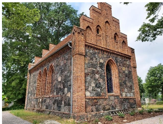
Ryc. 8. Kościoły: pw. św. Kazimierza w Jarosławsku (po lewej) i pw. Chrystusa Dobrego Pasterza w Krzynkach (po prawej)