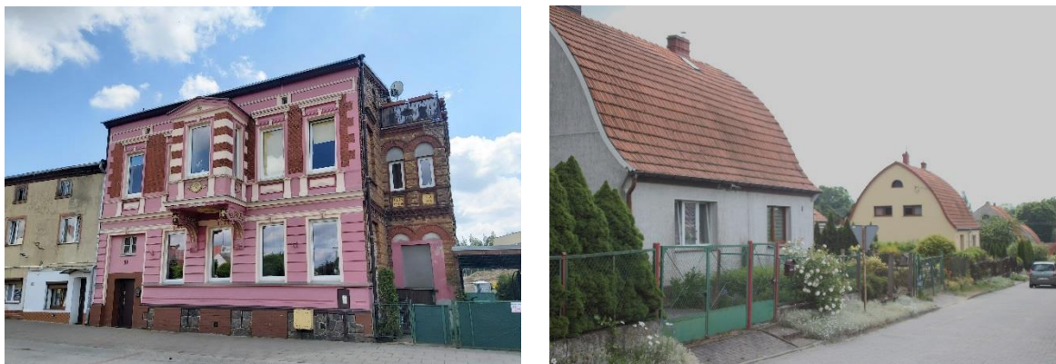
Ryc. 11. XIX-wieczna kamienica przy ul. Armii Polskiej 18 (po lewej) i zabudowa przy ul. Ogródki (po prawej)

Istotnymi elementami krajobrazu kulturowego wsi są budynki o funkcjach publicznych, takie jak szkoły (przekształcone obecnie na cele mieszkalne), zachowane w Jagowie i Przekolnie oraz zajazdy wiejskie, których funkcje można uchwycić w formie architektonicznej budynków w Jarosławsku (nr 10) i Bolewicach (nr 38). Ciekawym elementem w strukturze zabudowy wiejskiej są nieliczne zachowane dawne remizy strażackie o niewielkiej skali i prostych formach, służące jako budynki garażowe dla sprzętu strażackiego. Najlepiej zachowana jest kamienna remiza w Jarosławsku i ceglana dwustanowiskowa remiza w Przekolnie.