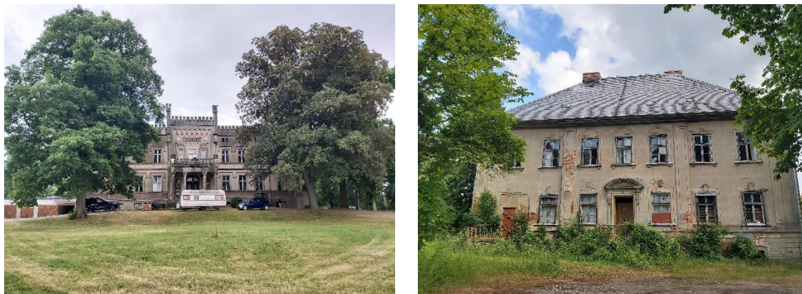
Ryc. 9. Pałac w Nadarzynie (po lewej) i pałac w Jagowie (po prawej)

Na terenie gminy zachowała się liczna grupa skromnych rezydencji wybudowanych na początku XX w., nawiązująca do charakterystycznych cech budownictwa wiejskiego, np. po przez użycie dekoracyjnej struktury ryglowej we fragmentach elewacji (Bukwica, Lubianka). Interesującym przykładem dworu o historyzującej formie i modernistycznym wystroju rzeźbiarskim, nawiązującym do motywów renesansowych jest nowy budynek dworu w Przekolnie, powstały lub gruntownie przebudowany w okresie międzywojennym. Inne dwory, takie jak w Będargowcu, Boguszynach, Płotnie, Wierzchnie oraz przy dawnym zespole folwarcznym Klukowo (ul. Kościuszki 16 w Pełczycach) charakteryzują się małą skalą, prostą formą architektoniczną i skromnym detalem.