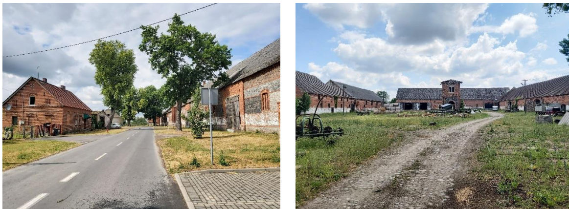
Ryc. 10. Zabudowa folwarczna w Płotnie (po lewej) i Jagowie (po prawej)

Pomimo poważnych, powojennych przekształceń (lub zniszczeniu) wielu założeń folwarcznych (np. Brzyczno, Jarosławsko, Lubiana, Lubianka, Niesporowice, Przekolno, Sarnik), stan zachowania architektury folwarcznej na terenie gminy jest zadowalający. Szczególnie istotny jest fakt zachowania większości okazałych założeń folwarcznych i wielu budynków gospodarczych o wysokich walorach zabytkowych.