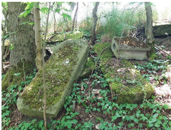
Ryc. 14. Macewy z cmentarza żydowskiego w Pełczycach