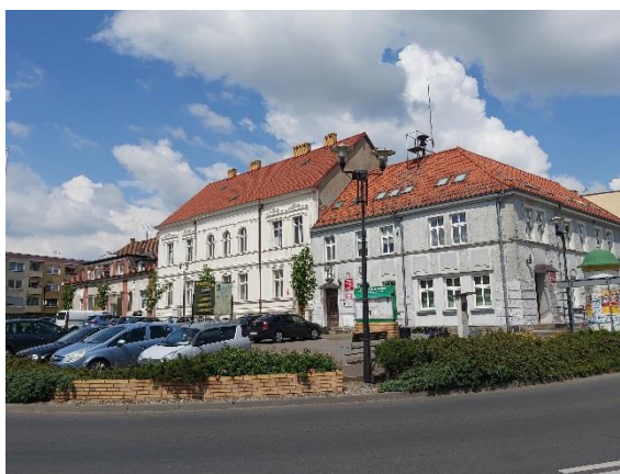
Ryc. 12. XIX-wieczne budynki ratusza i poczty we wschodniej pierzei rynku w Pełczycach

Zabytki techniki i architektury przemysłowej są najmniej liczną kategorią zabytków występujących na terenie gminy. Zaliczyć do tej kategorii można zespół stacyjny w Lubianie wraz z towarzyszącą mu zabudową mieszkalną, o formach charakterystycznych dla tego typu budownictwa z przełomu XIX i XX w.; wiadukt drogowy w okolicach Wierzchna oraz młyn Rakoniew (w granicach Pełczyc) – nie zachowała się większość dawnego wyposażenia i urządzeń młyna jednak obiekt ma istotne znaczenie ze względu na formę architektoniczną budynku i miejsce w krajobrazie kulturowym. Metryka tego młyna sięga XIII w. i jest związana z założeniem pobliskiego klasztoru cysterek.