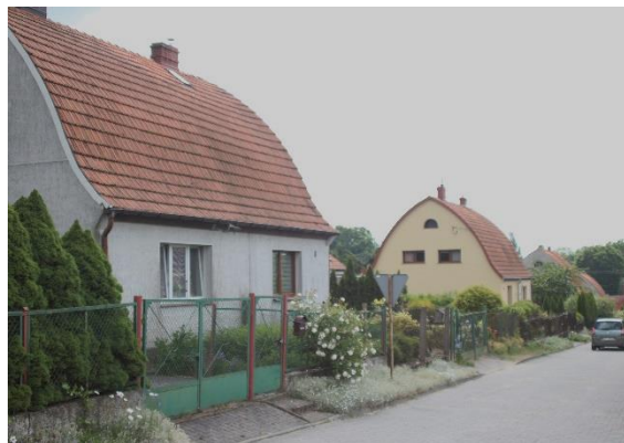
Ryc. 11. XIX-wieczna kamienica przy ul. Armii Polskiej 18 (po lewej) i zabudowa przy ul. Ogródki (po prawej)

Istotnymi elementami krajobrazu kulturowego wsi są budynki o funkcjach publicznych, takie jak szkoły (przekształcone obecnie na cele mieszkalne), zachowane w Jagowie i Przekolnie oraz zajazdy wiejskie, których funkcje można uchwycić w formie architektonicznej budynków w Jarosławsku (nr 10) i Bolewicach (nr 38). Ciekawym elementem w strukturze zabudowy wiejskiej są nieliczne zachowane dawne remizy strażackie o niewielkiej skali i prostych formach, służące jako budynki garażowe dla sprzętu strażackiego. Najlepiej zachowana jest kamienna remiza w Jarosławsku i ceglana dwustanowiskowa remiza w Przekolnie.