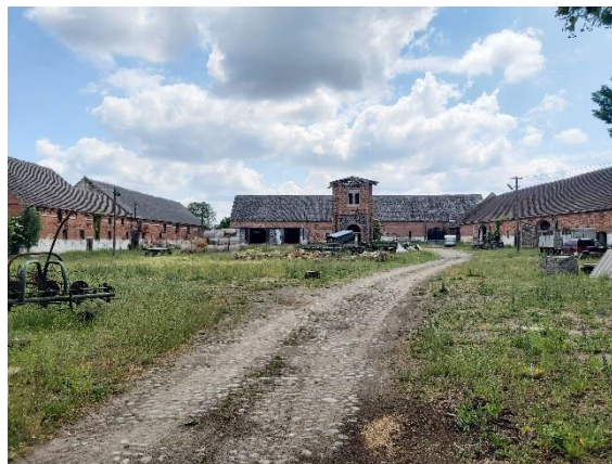
Ryc. 10. Zabudowa folwarczna w Płotnie (po lewej) i Jagowie (po prawej)

Pomimo poważnych, powojennych przekształceń (lub zniszczeniu) wielu założeń folwarcznych (np. Brzyczno, Jarosławsko, Lubiana, Lubianka, Niesporowice, Przekolno, Sarnik), stan zachowania architektury folwarcznej na terenie gminy jest zadowalający. Szczególnie istotny jest fakt zachowania większości okazałych założeń folwarcznych i wielu budynków gospodarczych o wysokich walorach zabytkowych.