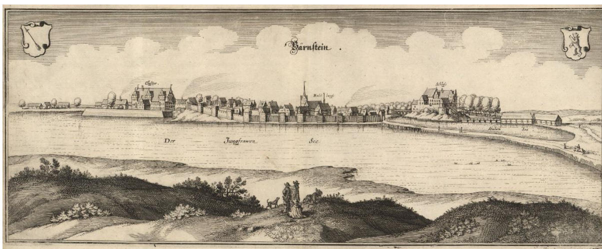
Ryc. 1. Panorama Pełczyc na miedziorycie Matthaeusa Meriana [rycina z dzieła M. Zeiller, „Topographia Electoratus Brandenburgici et Ducatus Pomeraniae” (1652). Tabl. XVI]

Na wschód od Starego Miasta, z niewielkiej osady o wczesnośredniowiecznym rodowodzie i rzemieślniczym charakterze rzemieślniczym, wykształcił się miejski układ urbanistyczny. Jego główną osią był średniowieczny szlak handlowy łączący Berlin ze Świdwinem. Z czasem ta część Pełczyc zyskała nazwę Nowego Miasta. Ze względu na naturalne ukształtowanie terenu układ przestrzenny Nowego Miasta uzyskał nieregularną formę z rynkiem na planie trapezu. Nowe Miasto otoczone mokradłami i korzystające z ochrony pobliskiego grodu i umocnionego Starego Miasta nie miało obwarowań a jedynie trzy bramy, których zasadniczą funkcją był pobór myta. W sąsiedztwie Nowego Miasta, ok. 1290 r., na wyspie przy południowo-wschodnim brzegu jeziora został wzniesiony zamek (uwieczniony na rycinie Meriana z 1652 r.).