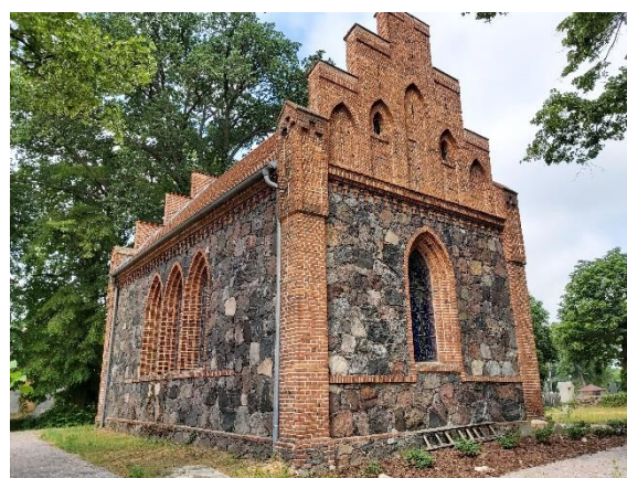
Ryc. 8. Kościoły: pw. św. Kazimierza w Jarosławsku (po lewej) i pw. Chrystusa Dobrego Pasterza w Krzyńkach (po prawej)